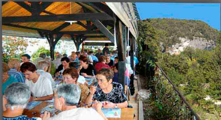
Terrasse dominant la Vallée de la Vézère